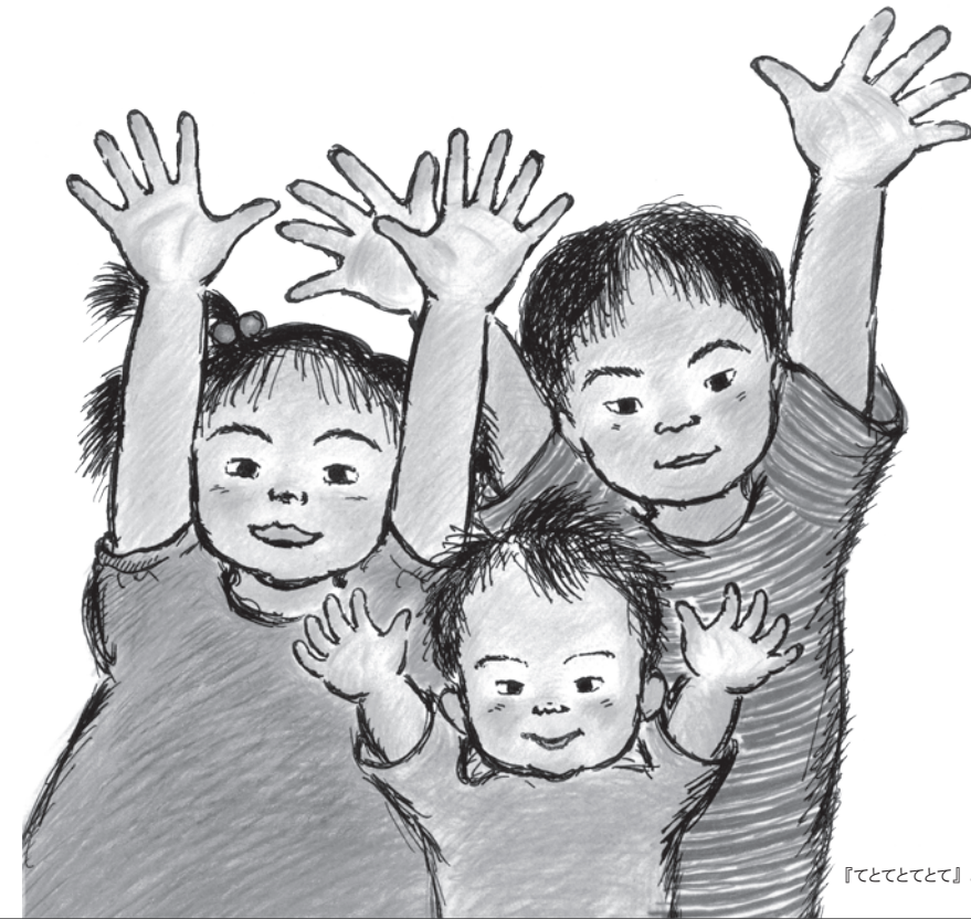
『てとてとて』より © Keiko Hamada 2008